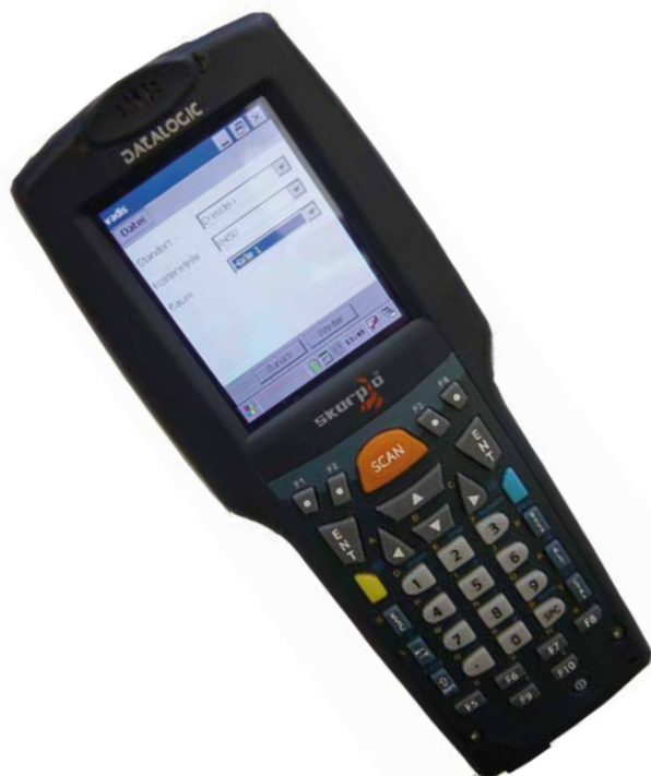
Mobiles Datenerfassungsgerät (MDE)