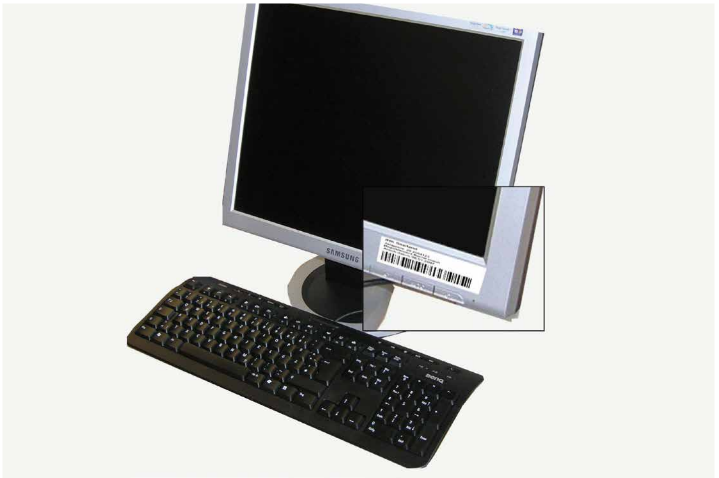
Kennzeichnung des Inventars durch Barcodelabel

Edition. Der Soll – Ist Vergleich des kompletten Anlagenstamms nach kostenrelevanten Kriterien, das Kennzeichnen von Neuanschaffungen sowie das Feststellen von Vollabgängen oder defekten Anlagen bestimmen den Prozess der Inventur. Das Ergebnis dieses Prozesses ist eine der Grundlagen für z. B. Budgetplanungen der Folgejahre oder für das Erstellen einer aussagekräftigen Bilanz.