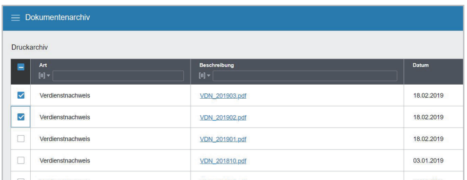
Abbildung: Übersicht der zum Vertrag und Mitarbeiter gehörenden Dokumente