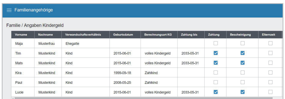
Abbildung: Angaben zu Familienangehörigen und Kindergeld